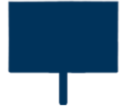
6 DIGICITY EKRAANI