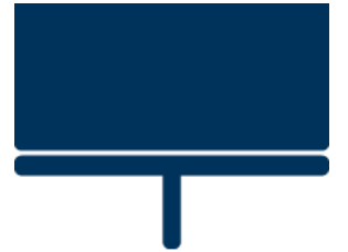
5 DIGIROAD EKRAANI